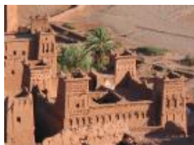
Route Vallée des Roses et des Kasbahs