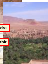
Gorges du Dadès