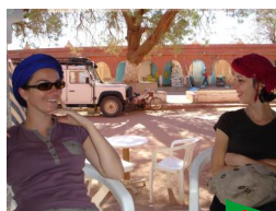
Vallée de l'Ounila Kasbah de Telouet

4 jours, 3 nuits avec www.saidmountainbike.com