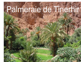
Palmeraie de Tinerhir