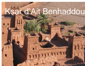
Ksar d'Ait Benhaddou