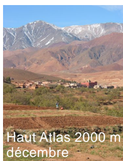
Haut Atlas 2000 m décembre