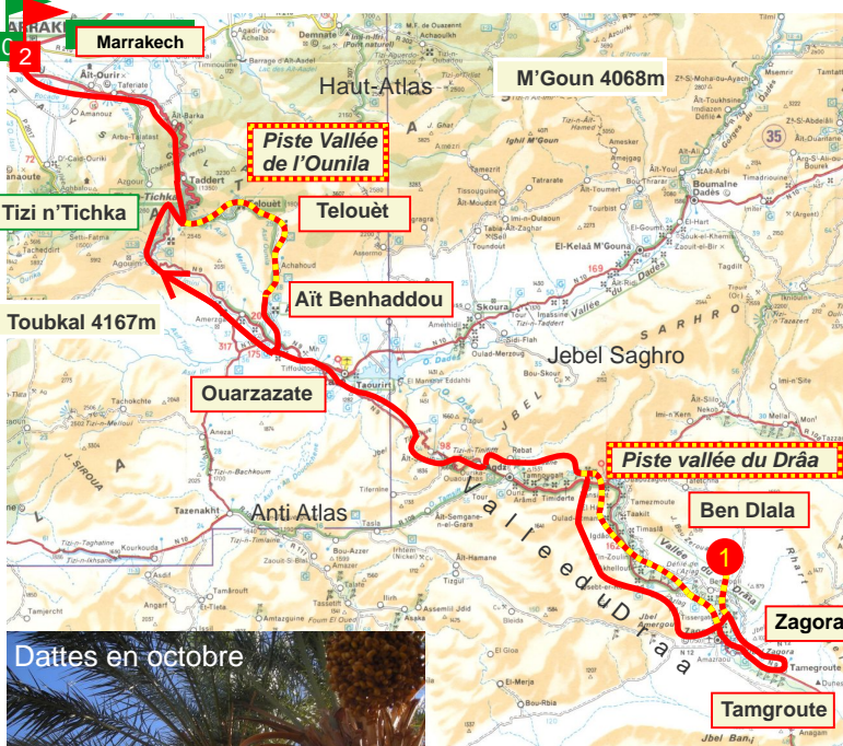
Dattes en octobre